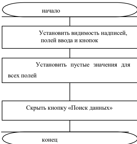
Рис3. Алгоритм метода «Видим ввод»